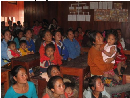
des parents attentifs et impliqués

Elle a ainsi présenté de manière détaillée le projet des deux écoles, d'une cantine offrant des repas équilibrés, du suivi médical des enfants âgés de 0 à 6 ans et de la mise en place de solutions génératrices de revenus à l'ensemble des parents d'élèves des deux villages de Lang Khang et Phone lors de réunions publiques au début du mois de décembre 2012. Les participants étaient nombreux et intéressés, manifestant leur volonté d'être acteurs du projet.