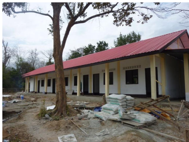
Ecole maternelles de Lang Khang et Phone

Les événements se sont succédés rapidement depuis le démarrage de notre projet au Laos en août 2012. Après la signature de l'accord de coopération avec la Province de Khammouane fin octobre, les travaux de construction ont commencé dès novembre et sont aujourd'hui bien avancés ! Les deux écoles maternelles de Lang Khang et Phone accueilleront bientôt au total 180 enfants.