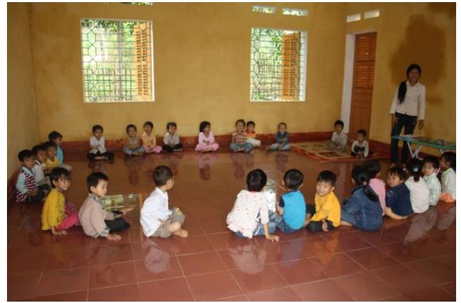
L'accueil des premiers enfants dans l'école de U