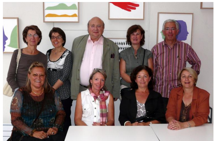
De gauche à droite (haut et bas)