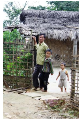
Une famille de Tan Lap