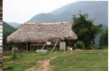
Maison H'mong à My A

Quelques nouvelles écoles de la commune de Yen Luong :