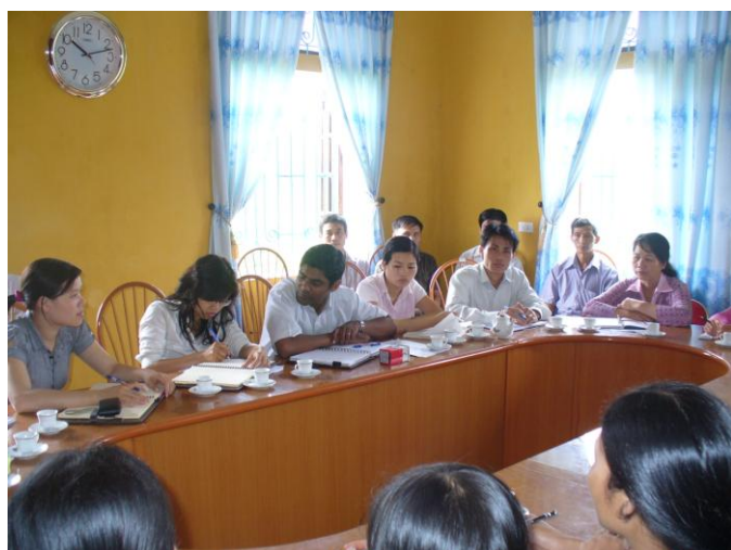
L'équipe Sourires d'Enfants...

Toutes les écoles dont les constructions sont prévues en 2009 seront terminées pendant l'été, une grande fête d'inauguration sera organisée dans chaque commune début septembre lors de la prochaine rentrée scolaire.