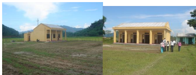
Et les premières écoles terminées ...