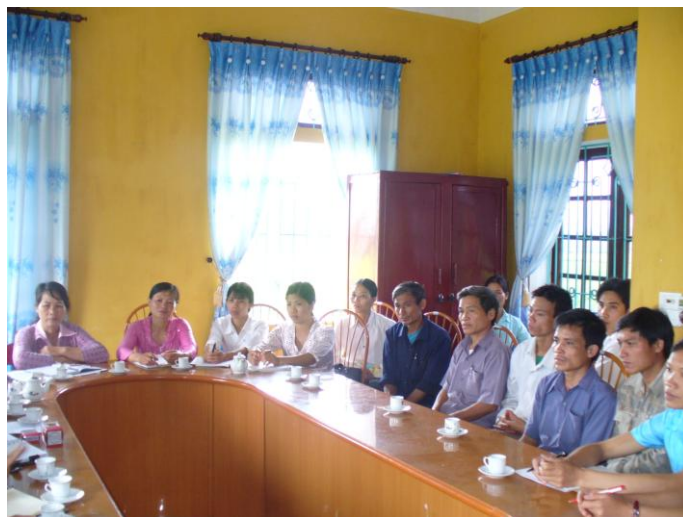
Les autorités locales ...