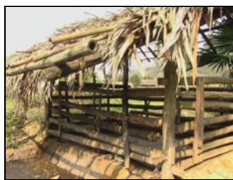
La maison traditionnelle Muong sur pilotis de la famille de Phi, et la porcherie qui aura bien besoin d'être rénovée.