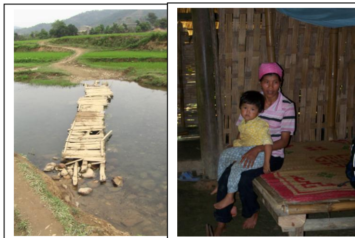
Précarité d'un pont Simplicité de l'habitat ...

L'étude en partenariat avec le Cirad est en cours (Centre de Coopération Internationale en recherche Agronomique pour le développement – Montpellier)