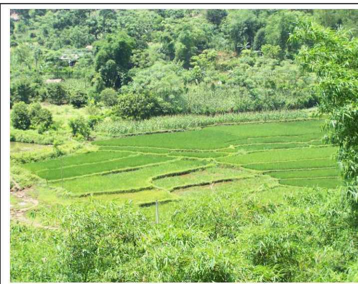
Les petites parcelles de riz familiales à Chen